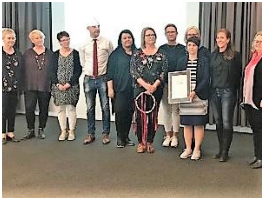
Ceremoni 27 april