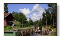
Slussen vid Buterud

Buterud Buterud ligger mellan sjöarna Åklång och Råvarp. Här kan man göra vandringar på båda sidor om Dalslands kanal, bestiga Buterudsklacken med vacker utsikt samt besöka Buteruds naturreservat öster om Buterud.