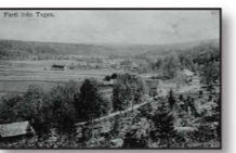
Vykort från Tegen omkring förra sekelns kuffet

Kulturmiljö av riksintresse Byarna och odlingslandskapet mellan Tegen och Hallersbyn är av riksintresse för kulturminnesvården. Många av byggnaderna är fina exempel på den dalsländska bebyggelsen från mitten av 1800-talet och är samlade i gamla bybildningar. Mellan åren 1856-1916 fanns en brunns- och badanstalt i Tegen med hälsobringande järnhaltigt vatten.