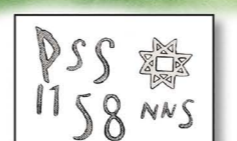
Fornminnen och graffiti

6 En skogsväg till höger om bygdegården leder till ett område kallat "fyra", vilket innebär skoglös grusmark som tidvis är översvämmad.