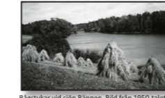
Rågstukar vid sjön Rannen. Bild från 1950-talet.

18 Kvarnstenar på Lianefjället I två hundra år, från början av 1700-talet till början av 1900-talet, högs kvarnstenar här på Lianefjället. Går man några hundra meter, rakt in i skogen mot kraftledningen, kan man på många ställen hitta påbörjade och skadade kvarnstensämnen. Ordet "fjäll" betecknar ingen fjällnatur utan är en gammal benämning på utmark.