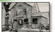
Källhults affär på 1950-talet

Buterud Buterud ligger mellan sjöarna Åklång och Råvarp. Här kan man göra vandringar på båda sidor om Dalslands kanal, bestiga Buterudsklacken med vacker utsikt samt besöka Buteruds naturreservat öster om Buterud.