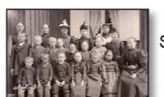
Elever vid Källhults skola 1896

4 Källhult Här fanns lanthandel med post mellan åren 1921 och 1968. Strax söder om den gamla affären finns en källa som aldrig fryser eller sinar. Det är den som har gett namn åt byn. "Hult" betyder lövskog.