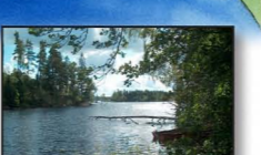
Sågevikens och Hallersby kvarn

Väster om vägen vid pausplatsen i Hallersbyn finns spår efter ett vattenkraftverk. Till höger om bäckfåran är en tunnel sprängd genom berget och på andra sidan finns en damm. Utefter bergsslutningen rinner många bäckar vilka, som denna, flitigt har utnyttjats att ge kraft till kvarnar, sågverk, spånhyvlar, smideshammare samt vadmal- och benstampar.