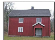
Dalslandstuga i Ränsliden