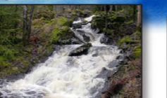
Bäckarna gav kraft

11 Hallersbyn och Håbolsbyn Tvåvåningshusen med ljusmålad fasader är efterföljare till Dalslandstugan och typiska för jordbruksfastigheter från 1850-talet och framåt. Många av husen har skiffertak. Gårdsnamnet Hallersbyn kommer sannolikt av mansnamnet Halvor.