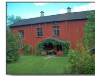
Parstuga i Tångebyn

När vägen byggdes Fram till början av 1900-talet fanns farbar väg förbi Årbol fram till Hallersbyn. Norr om Hallersbyn fick man ta sig fram på vindlande stigar mellan torp och gårdar. Körvägen fram till Ränsliden blev färdig år 1917 och resten av vägen till Mustadfors blev inte klar förrän 1936.