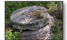
Kvarnstenar på Lianefjället

17A Lunnebosossen Lunnebosossen är en opäverkad naturmiljö med stor vildmarkskänsla och har ett rikt växt- och djurliv. 17B Lunnebo blockfält Vägen mot Bäckefors passerar ett säregt område med stora block som tros ha bildats i plötsliga framskjutningar av den stillastående inlandisen. Blockfältet och mossen ligger utanför kartan.