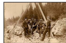
Bild från vägbygget på 1930-talet

Upptäck Dalsland vid sidan om de stora stråken! Färdas genom gamla byar och odlingsmarker. Se den omväxlande naturen med djupa skogar, små tjärnar och virvlande bäckar. Njut av utsikter över sjöar och berg. Stanna gärna till och gå på kortare eller längre strövtåg.