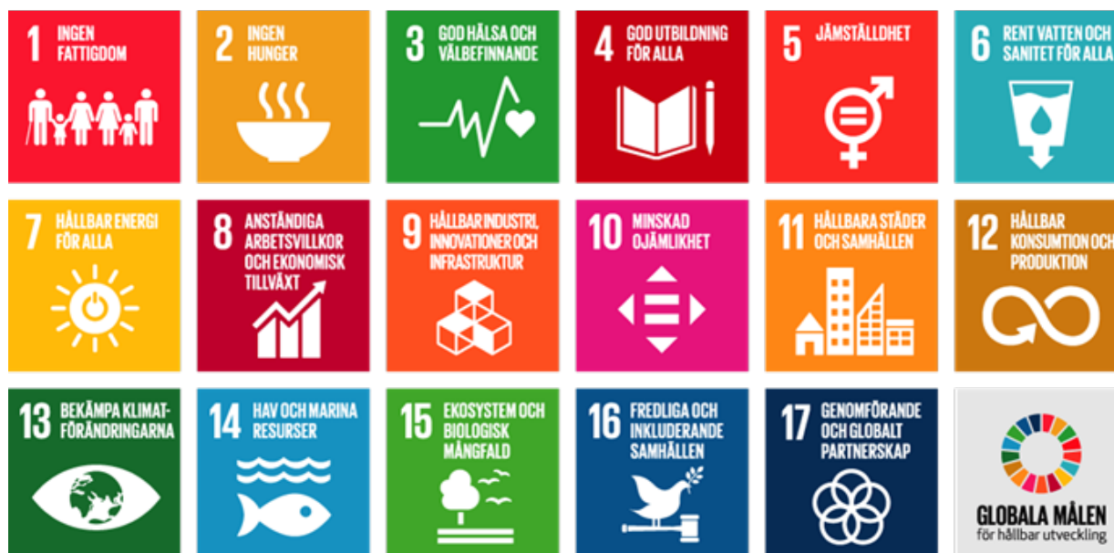
Figur 3 — De 17 globala hållbarhetsmålen 6

Anm.: Vill du läsa mer om de globala hållbarhetsmålen se www.globalamalen.se