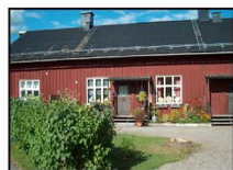
I de gamla upprustade arbetarbostäderna bor många som studerar på Stenebyskolan.