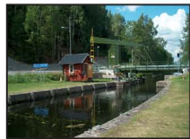
Slussen i Mustadfors

Närheten till norska gränsen gjorde att man under beredskapstiden under andra världskriget byggde stridsvagnshinder på många platser. Två pirar i tjärnet vittnar om att här funnits vägbommar. På berget ovanför finns ett berg- rum för bevakning. Detta är numera igenmurat.