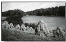
Rågstugar vid sjön Rännen. Bild från 1950-talet.