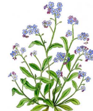
Förgätmigej, Dalslands landskapsblomma