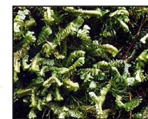
Stor revmosa, Dalslands landskapsmossa