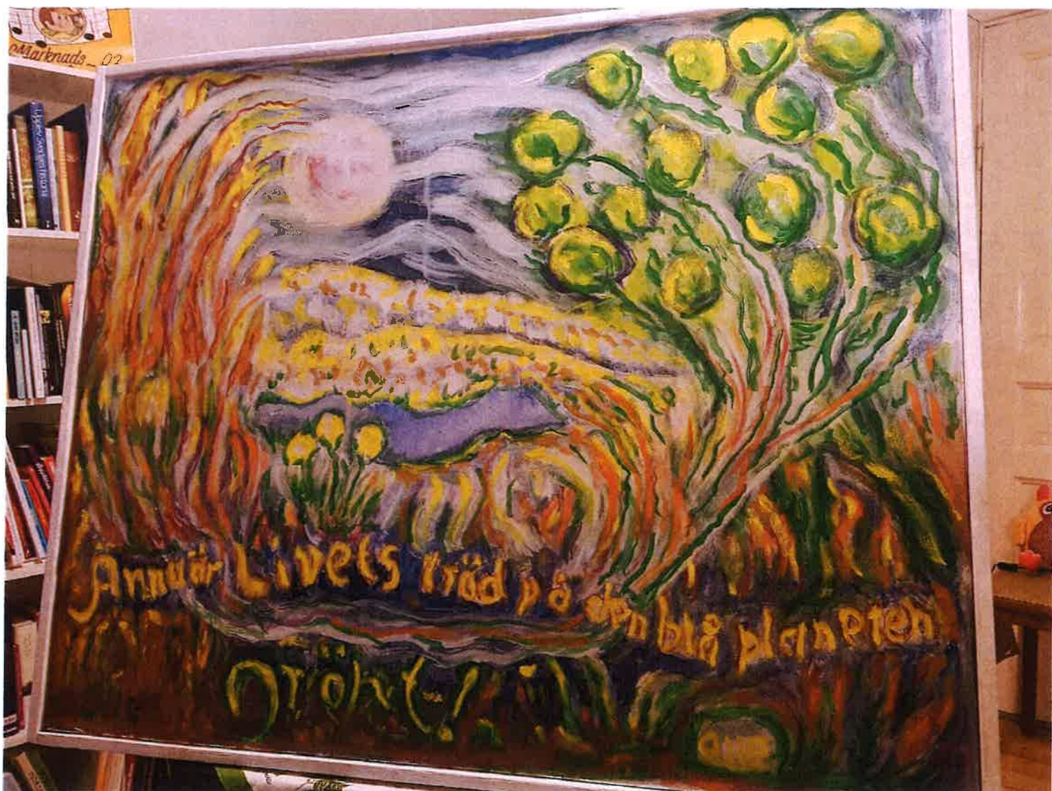
2 Ännu är livets träd på den blå planeten grönt! Målning av vår saknade medlem, Olle Collén