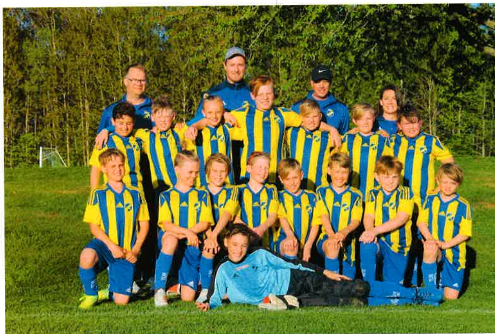
Kroppefjälls IF P11 2019

Killarna i P11, tränare och föräldrar tackar Kroppefjälls IF för hjälpen under året och tar nya tag för säsongen 2020.