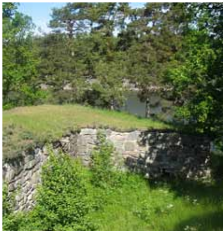
Dalaborgs slottsruin vid Väneren.

Ett trevligt utflyktsmål är Dalaborgs slottsruin som ligger på en liten udde norr om Dalbergså mynning. Borgen uppfördes 1304 av Magnus Ladulås söner, hertigarna Erik och Valdemar och byggdes då på tidigare ruiner. Hertig Erik hade en idé om att skapa ett eget, västnordiskt rike, ungefär med samma gränser som dagens Västra Götaland. Passa på att besöka den gamla lövlunden vid Kvantenburg herrgård ett par kilometer sydväst om Dalaborg. I lövlunden som gränsar till ån växer ek, lönn, alm, hägg och hassel. Även Dalbergså mynning som är en naturlig djuphamn är värt ett besök. Mot Väneren finns en unik hållristning av en älg!