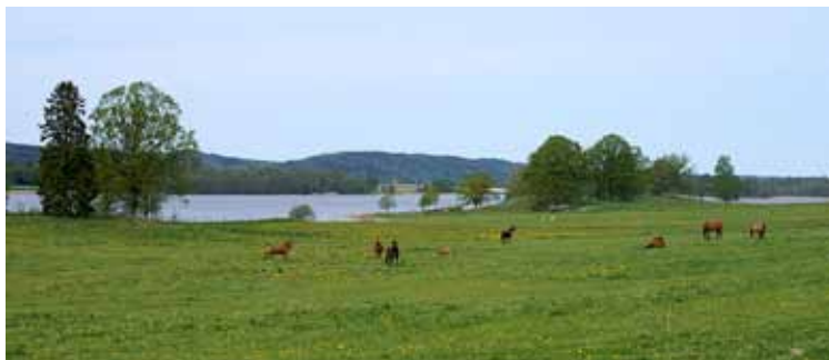
Betesmark vid Kolungen

den gamla typiska dalsländska gården och markerna är numera bevarat som ett kulturresevat. Området har ett rikt fågelliv och intressant flora. Har du tur kanske du kan få syn på Trollfladdermusen som hittades här 2006 för första gången i Västra Götaland. Du kan på ett utmärkt sätt ta dig hit på cykelbanan från Mellerud eller Dals Rostock.