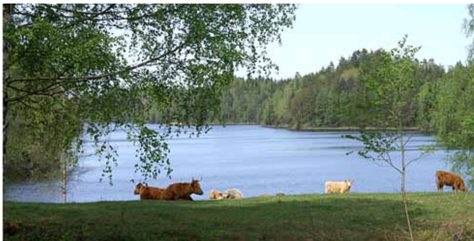
Betesdjur vid sjön Rännen

nytt. Området är ett populärt utflyktsmål framförallt under vår och försommar då ängsfloran är som vackrast. Förutom den rika förekomsten av liljekonvalj kan du också finna orkidéer som Sankt Pers nycklar, brudsporre, nattviol och tvååblad. Ovanliga lavar förekommer i området som är rikt på lövskog med gamla träd. Det betyder att hackspettarna gärna hittar hit också.