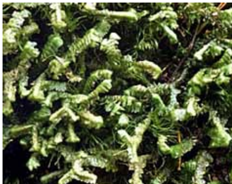
Dalslands landskapsmossa stor revmossa.

Området ligger i en granskogsbevuxen bäckravin med omgivande myrmarker och sumpskog runt Stutedalstjärnen. Sväng av norrut i Dalskog vid gamla lanthandeln och följ vägen 2,5 km där reservatet ligger på vänster sida av vägen. Här har över 300 olika arter av mossor hittats vilket är unikt för landet och för ett så litet område. Bland högre växter kan nämnas gotlandsag, myggblomster samt murruta. Orsaken till den omfattande floran är Dalformationens omväxlande berggrund med kalkhaltig skiffer och näringsfattig kvartsitsandsten. Det ger en mångskiftande natur i området.