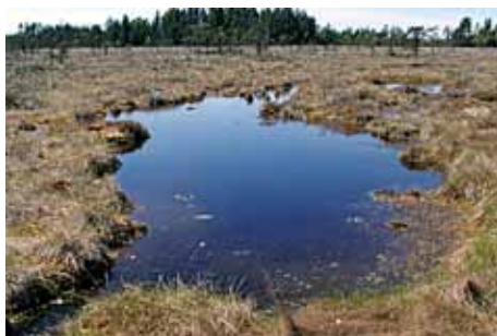
Öppen göl på Lunnebosossen

Mossen är en opåverkad naturmiljö med stor vildmarkskänsla.