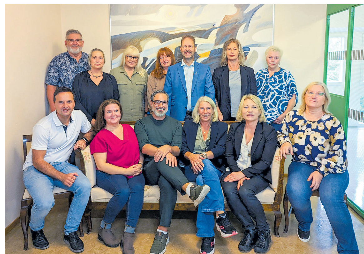
Politiskt samråd Mellerud och Bengtsfors samt förvaltningsledning.

I en politiskt styrd organisation är det viktigt att hitta en väl fungerande ledning och styrning och en tydlig rollfördelning. Pa-