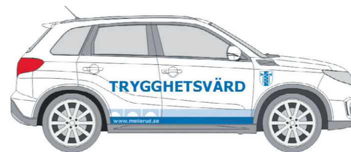
Skiss på trygghetsvårdarnas nya bil – en viktig del av deras arbete för trygghet, synlighet och närvaro i hela kommunen.