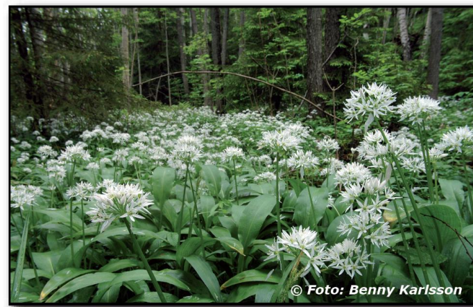
Ramslöken blommar i början av juni

Den övriga växtligheten är också mycket rik med t.ex. idegran ( Taxus baccata ), tandrot ( Cardamine bulbifera ), spåtistel ( Carlina vulgaris ), sårläka ( Sanicula europaea ) och orkidéer. Det här är marker för bl.a. lodjur ( Lynx lynx ), vitryggig hackspett ( Dendrocopos leucotos ), mindre hackspett ( Dendrocopos minor ) och hasselsnok ( Coronella austriaca ). Den markerade strövstigen fortsätter in i Buteruds naturreservat, vilket sträcker sig ytterligare 5 kilometer norrut.