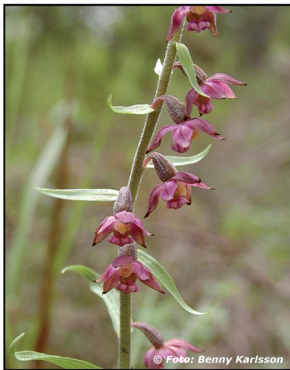
Purpurknipprot ( Epipactis atrorubens )

Vill du lämna bidrag till information/skötsel av kommunala naturreservat, SMS:a 72456, ange Broschyr 20 kr eller Sponsring 50 kr.