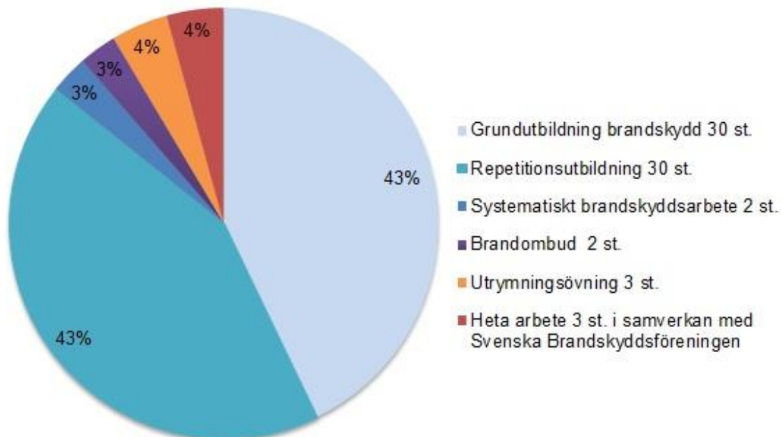
Figur 1. Cirkeldiagram avseende antal genomförda externutbildningar jan-aug.

Personal från enhet Samhällsskydd har medverkat vid mässor för att informera om brandskydd till den enskilde samhällsmedborgaren. Utbildning till medlemskommunernas personal i brandskydd har skett vid 70 tillfällen fördelat enligt följande;