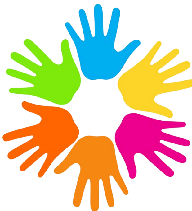
Figur med sex händer i olika färger symboliserar Melleruds kommuns arbete med tillgänglighet.