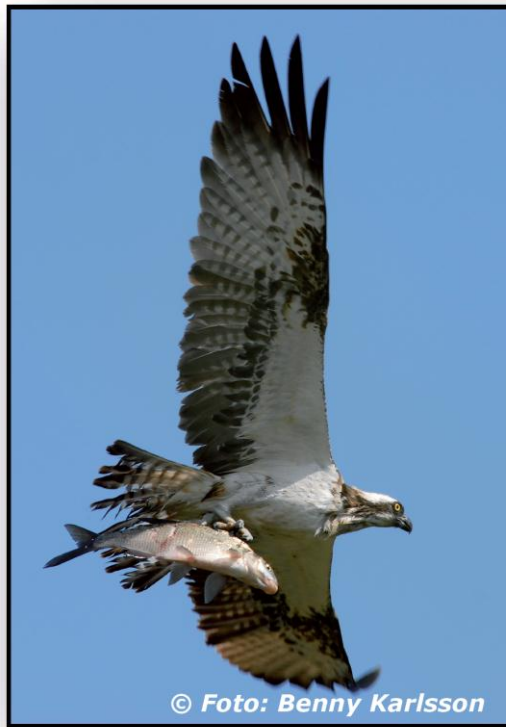
Fiskgjuse ( Pandion haliaetus ) med fångad fisk

Syftet med reservatet är att bevara områdets rika fågelliv genom bland annat vasslätter i åmynningen samt sköta området i övrigt så att fåglar, växter, ormar och groddjur kan trivas. Syftet ska uppnås med anpassad skötsel.