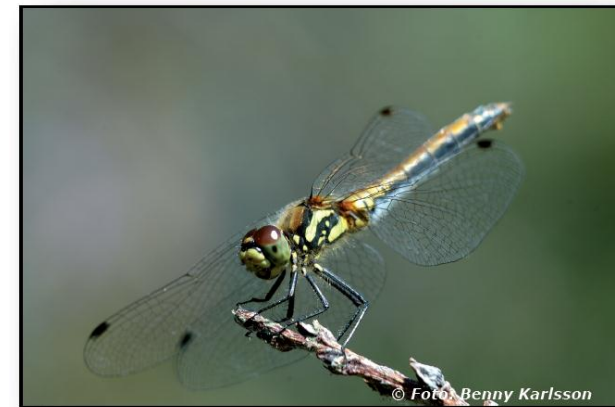
Trollslända ( Odonata )

Fågellivet är rikt med bl.a. kricka ( Anas crecca ), snatterand ( Anas strepera ), vigg ( Aythya fuligula ), brun kärrhök ( Circus aeruginosus ), enkelbeckasin ( Gallinago gallinago ), orre ( Tetrao tetrix ), rörsångare ( Acrocephalus scirpaceus ), sävsångare ( Acrocephalus schoenobaenus ) samt rosenfink ( Carpodacus erythrinus ). Havsörnen ( Haliaeetus albicilla ) gästar området. I närheten av hamninloppet finns Väners största skrattmåskoloni ( Larus ridibundus ) med cirka 1 200 par. Norr om Hasselängen finns en forntida gravgrupp med fyra stensättningar som delvis är övertäckta. markerat med R på kartan.