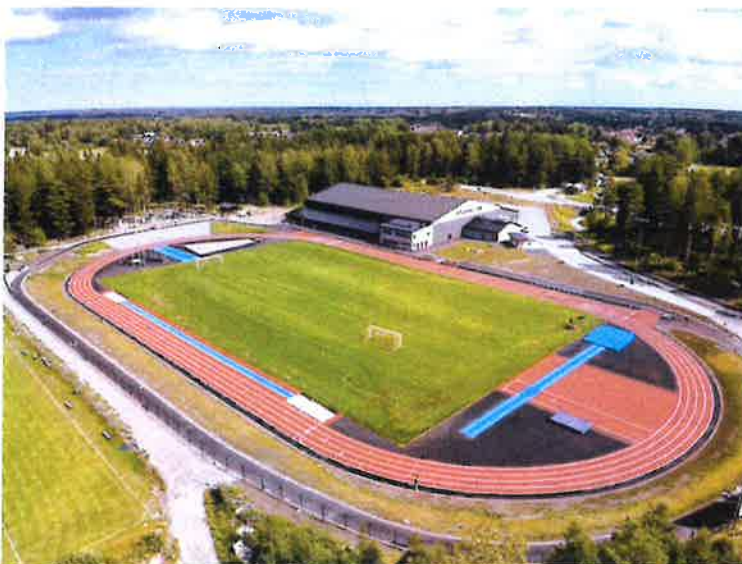
Exempel på liknande arena (Vegavallen i Tierp)

Alla medel som HIF får i stöd betalas naturligtvis ut till vår förening endast om projektet med allvädersbanor blir verklighet och motsvarar den beskrivning av Rådavallen som framgår av bifogad planritning och kostnadskalkyl (bilagor 1 och 2). I annat fall betalas inga externa bidrag ut och då finns bara kommunens egna pengar att använda till att rusta upp Rådavallen.