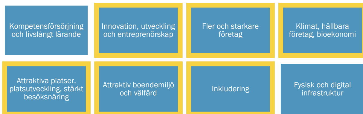
Bild 1: Sammanställning över återkommande teman i de regionala och delregionala planerna 10 samt lokala dokument och förstudier 11