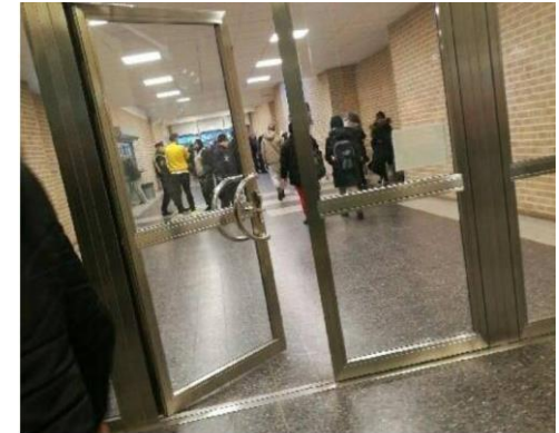
Didaktuslokalen fick stänga idag på grund av bråk.