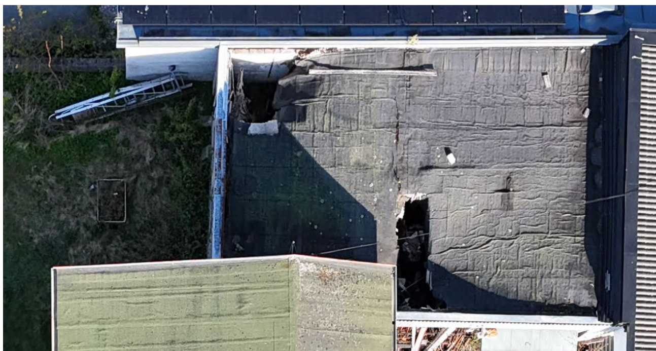
Foto F. Garagetak där delar har rasat in och övrigt tak ser ut att vara i dåligt skick.