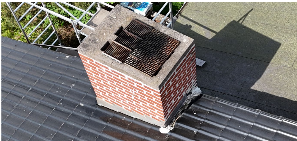
Foto B. Vid anslutning mot skorsten finns risk för fuktskador.