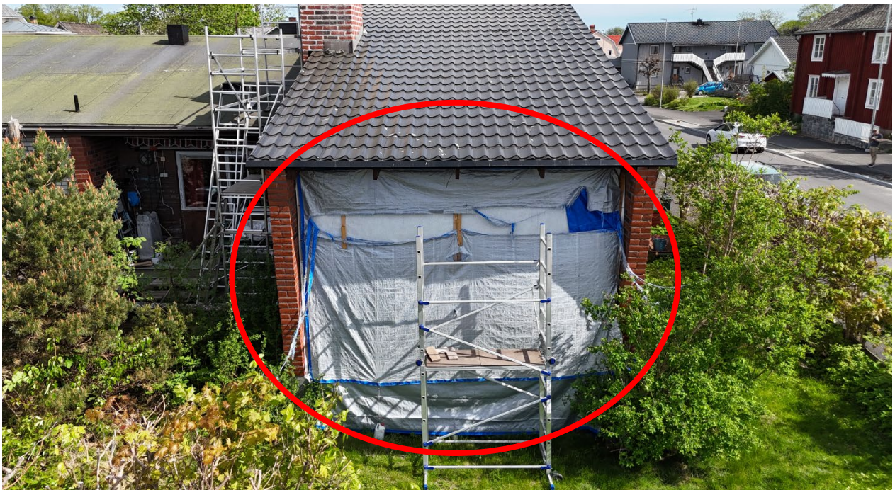
Foto E. Fasad mot Vilhelmsgatan som är täckt av presenningar, se röd ring.

Justerandes sign. KENT BOHLIN 2026-05-22 08:40:29