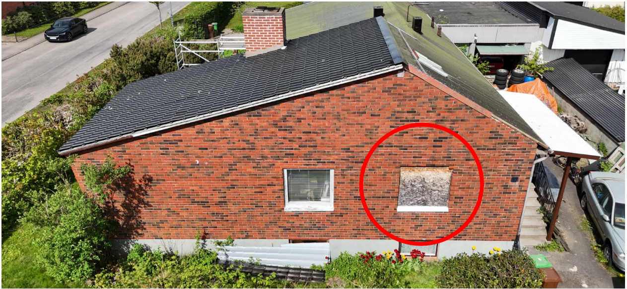
Foto D. Fönster på den östra fasaden som är igensatt av skivmaterial, se röd ring.