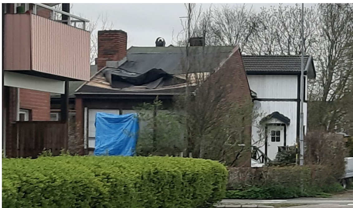
Foto G. Foto från innan taket lagades av fastighetsägaren.