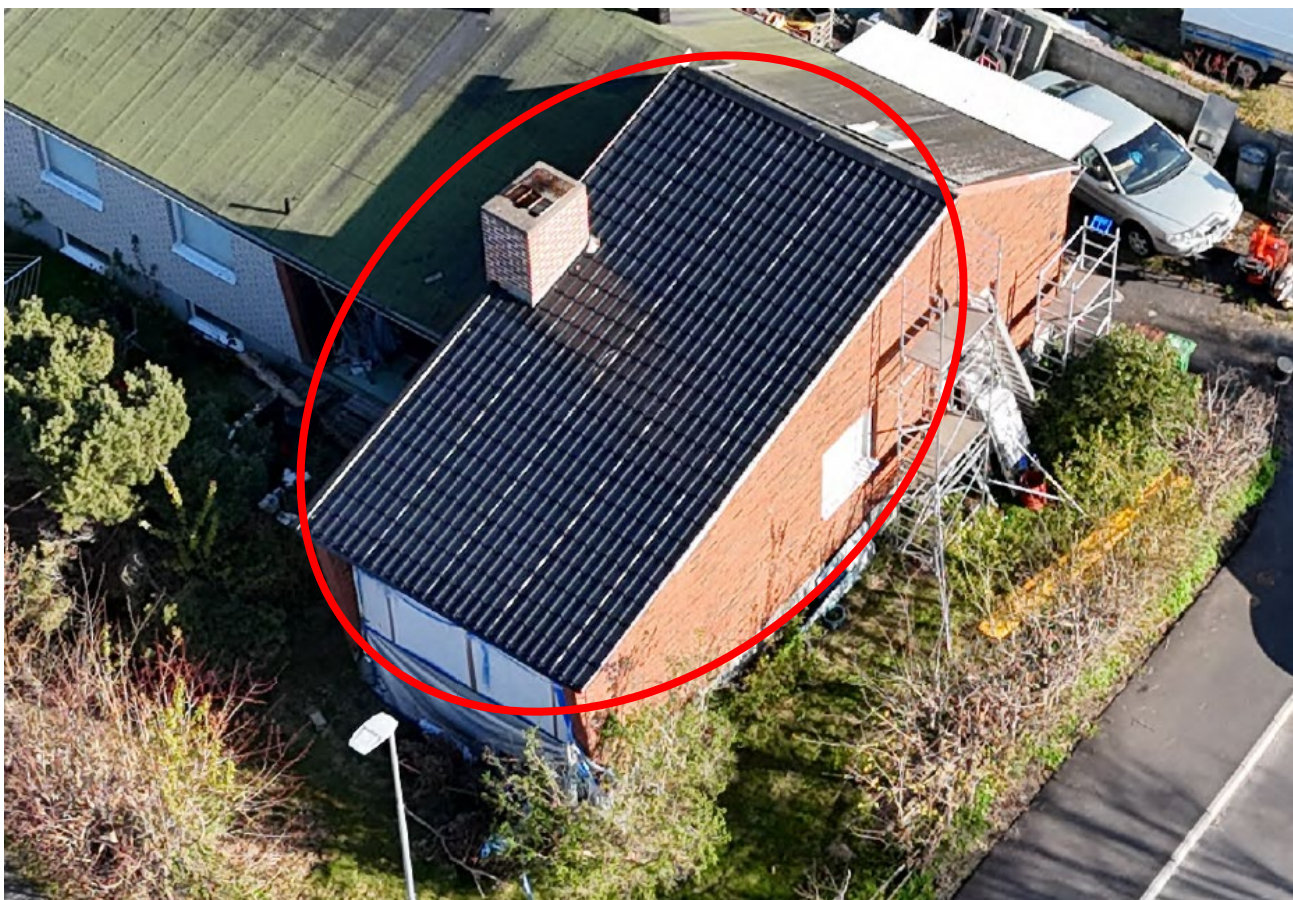
Foto A. Inringad del av taket har bytts till svart plåttak med takutsprång.

Justerandes sign. KENT BOHLIN 2026-05-22 08:40:29